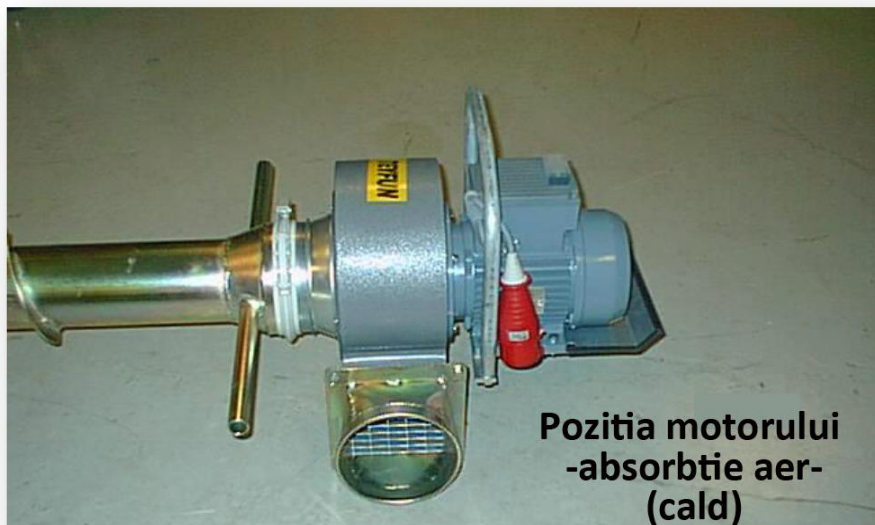
Pozitia motorului -absorbție aer- (cald)